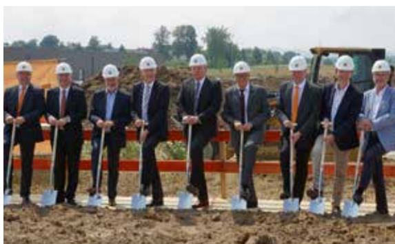
A szimbolikus építés megkezdésekor ásót ragadtak a WEINIG igazgatója, a HOLZ-HER menedzsere, a főpolgármester és az építésvezető.

A HOLZ-HER Nürtingenben már 100 éves történelemre tekint vissza. Az új épület a HOLZ-HER jövőbe tekintő kirakatablaka, sőt Nürtingen is mint telephely.